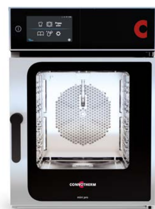
mini pro 6.10