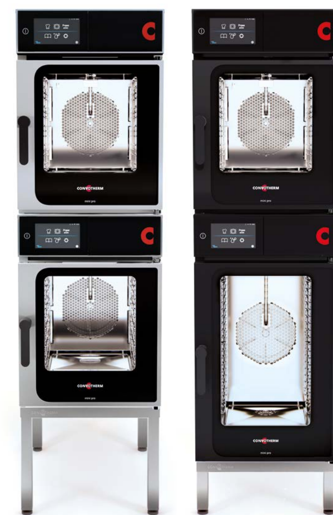
mini pro 6.10 + 6.10

Der mini pro überzeugt dank konkurrenzlos vieler Garverfahren durch unübertroffene Vielseitigkeit – von Frittieren bis Sous-vide-Garen. Damit ersetzt er gleich mehrere herkömmliche Küchengeräte und schafft mehr Platz und Effizienz in der Profiküche.