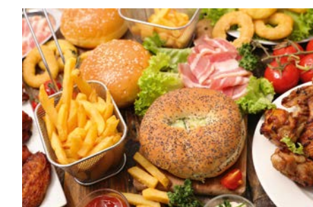
mini pro 6.10 + 10.10

Erweitern Sie Ihr Speisenangebot mit der enormen Vielseitigkeit eines Kombidämpfers.