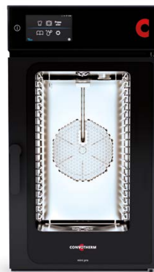
mini pro 10.10