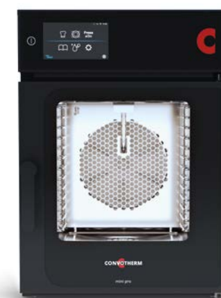
mini pro 6.06