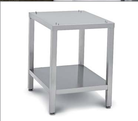
Untergestelle passend zu jedem mini