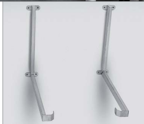
Wandbefestigung für sichere Montage über Arbeitsflächen