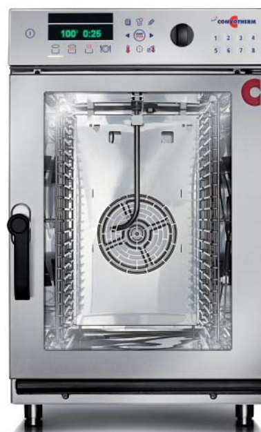
10.10 mini (10 x 1/1 GN)