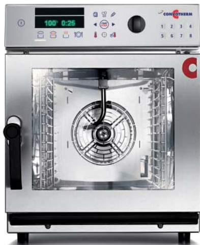
6.06 mini (6 x 2/3 GN) – auch mobil 6.10 mini (6 x 1/1 GN) – auch mobil

Zu unserer mini Serie gehören Combi Dämpfer in vier verschiedenen Größen: