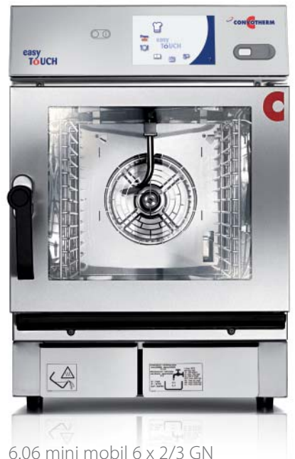
6.06 mini mobil 6 x 2/3 GN 6.10 mini mobil 6 x 1/1 GN