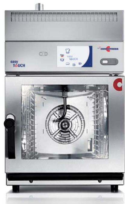
CONVOvent mini Kondensationshaube; ideal für Frontcooking.