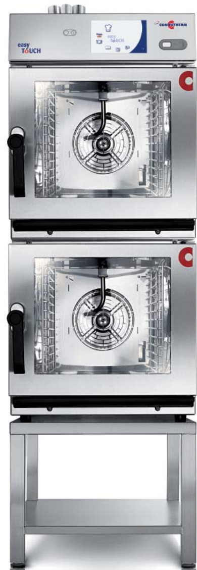
6.10 mini 2in1* (2 x 6 x 1/1 GN)

Unsere robusten Geräte mit unschlagbarer Langlebigkeit verfügen über alle Funktionen, die Sie heute in der modernen Küche brauchen: